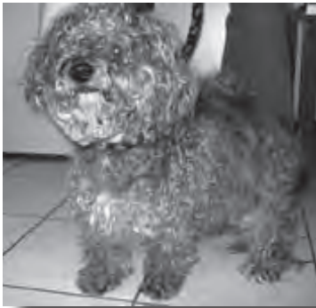
In schlechtem Zustand gefunden: „Bolle“, ca. 10 Jahre alt, wohnt jetzt überglücklich in seinem neuen Zuhause

Manche Menschen geben ihren Hund ab, weil sie in ein Pflegeheim müssen. Es gibt aber auch Leute, die ihren Hund abgeben, weil er alt und krank ist und sie ihn deswegen einfach nicht mehr wollen. Wenn ein alter Hund im Tierheim abgegeben wird ist das für den Halter, aber auch den Hund sehr schlimm.